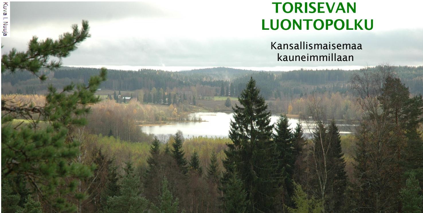
Kuva I. Nuuja

Maisema Inkerinkalliolta etelään Majajärvelle päin.