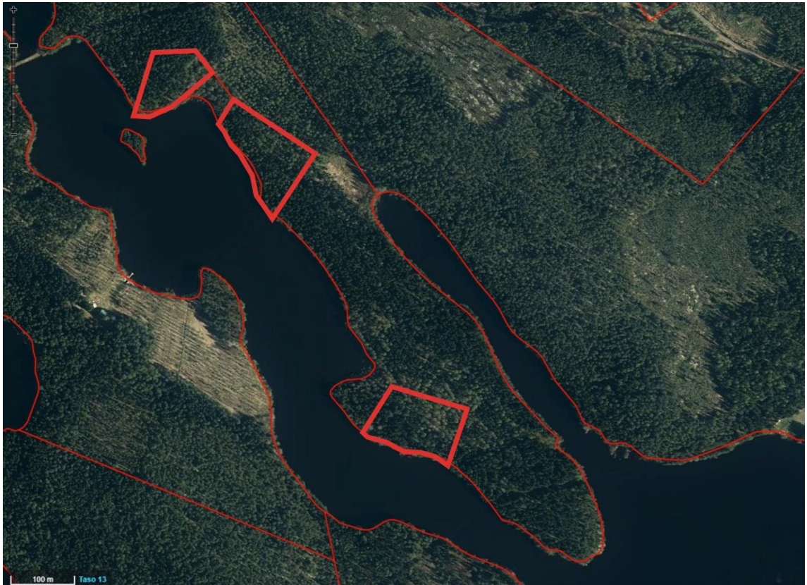
Kuva 3 Suunnittelalueen sijainti ilmakuvalla