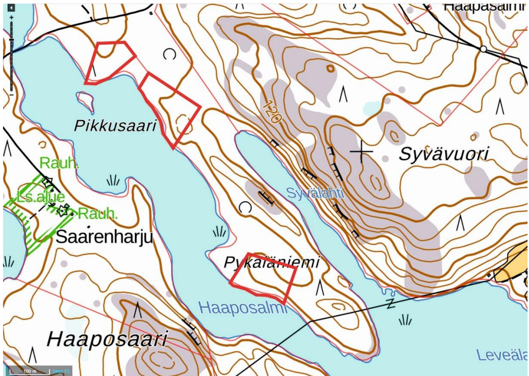
Kuva 2 Suunnittelualan sijainti peruskartalla